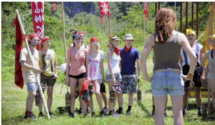
'Expeditie Robinson' kwam voor het eerst tot stand in Zweden, in 1997. Nog voor de eerste aflevering was uitgezonden, had er al een weggestemde deelnemer zelfmoord gepleegd.

»Aan de hand van de vooraf opgestelde psychologische profielen van de kandidaten weet je als programmamaker waar je naartoe moet. Uiteraard worden de op- ►